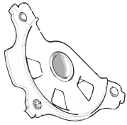
A - (1 PCS)